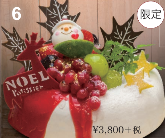
6 アンジュ エンジェル型のホワイトムース。フルーツをたっぷり盛り付けて、天使のような優しい味。 (直径15cm)