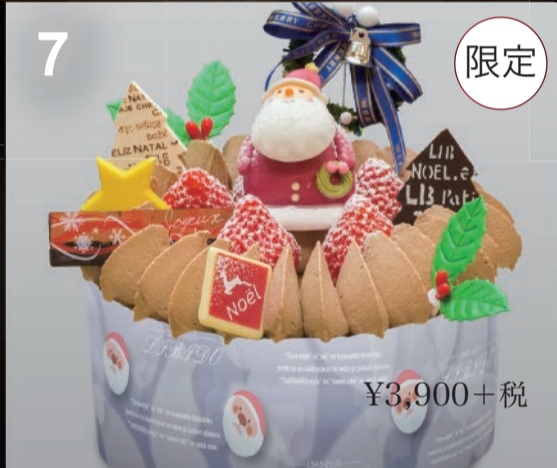
7 5号生チョコレート スポンジケーキを生チョコクリームで仕上げました。チョコの味わい豊かな当店の人気商品。 (直径15cm) 3~4人用