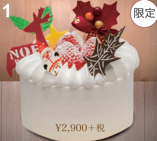
1 4号生クリーム 小さなクリスマスケーキ。大切な人と分かち合う、かわいいサイズです。 (直径12cm) 2~3人用