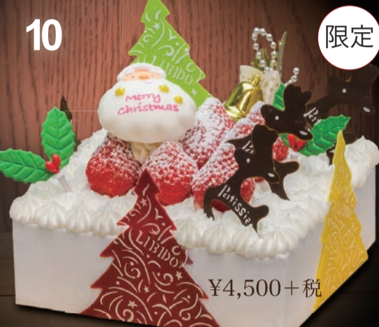
10 四角いデコレーション 四角いタイプのクリスマスデコレーション。パーティの夜に彩りを添えて…。 (15cm角)