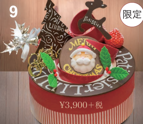
9 スペシャルアントルメ スポンジケーキをチョコの飾りでオシャレに演出。サイドのストライプがクリスマスカラー。 (直径15cm)