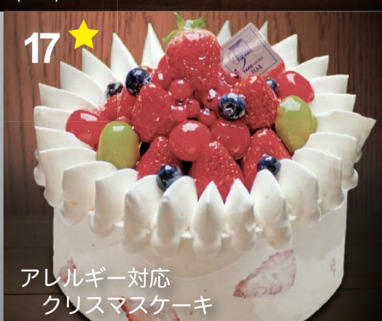
17 アレルギー対応クリスマスケーキ

ご予約のお客様にリビドー商品券プレゼント!(1,000円相当) ¥10,000+税より 思い出に残る素敵なクリスマスの演出に、あなただけの特別なデコレーション