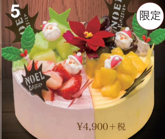
5 アラカルト マンゴー・いちご・チョコレート・抹茶、4種のフルーツケーキ。たっぷり楽しめる贅沢クリスマス。 (直径18cm)