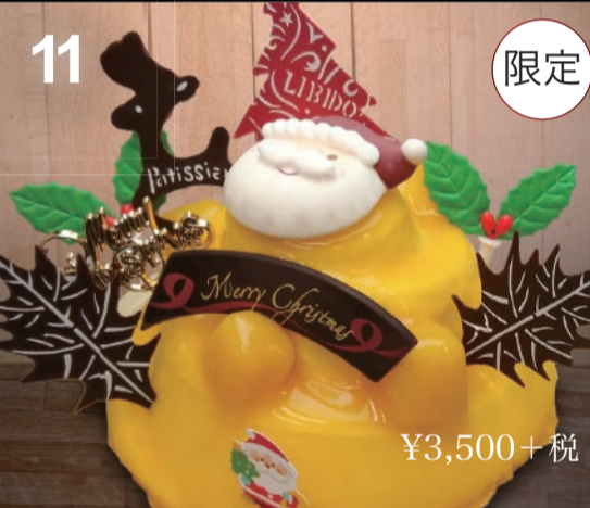
11 マンゴーのアントルメ マンゴーのムースにゼリー、中にはスポンジケーキを忍ばせて。聖なる夜に南国の香り。 (直径15cm)