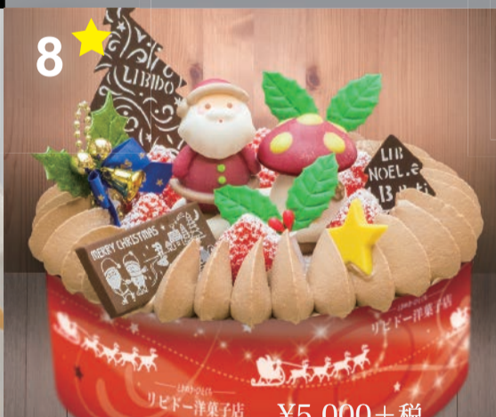
8 6号生チョコレート スポンジケーキを生チョコ仕上げ。自慢のチョコクリームをお楽しみ下さい。 (直径18cm) 5~6人用