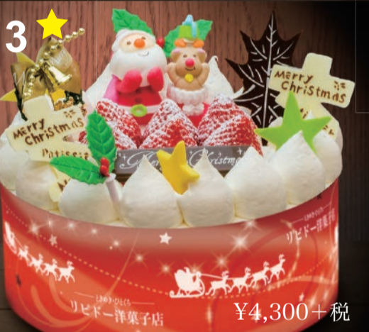
3 6号生クリーム ふんわりスポンジと生クリーム。家族の笑顔の中心に、キラキラ輝く甘い星。 (直径18cm) 5~6人用