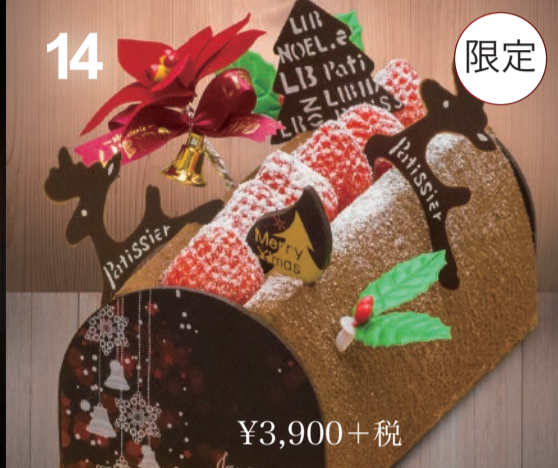
14 ブッシュ・ド・ノエル ブッシュ・ド・ノエルを、パティシエ独自の感性で。コーヒームースの切り株ケーキ。 (16cm)