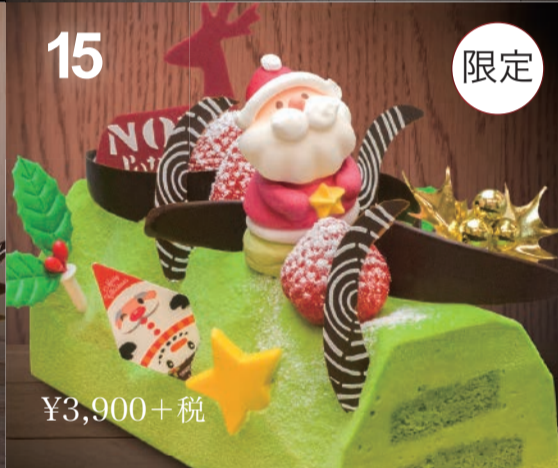
15 トランシュ・オ・抹茶 こだわりの抹茶ムースに抹茶のスポンジ。抹茶の列車に乗って夢の世界へ…。 (16cm)