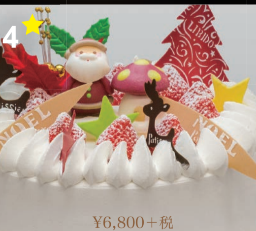
4 7号生クリーム 大切な人たちと囲む、とびっきりのクラシック。変わることないクリスマスカラー。 (直径21cm) 6~8人用