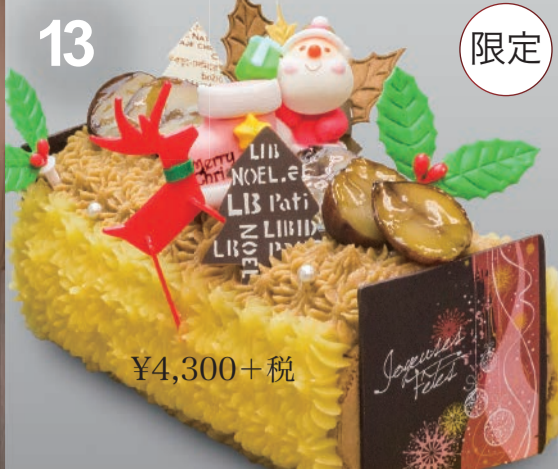
13 クリスマスモンブラン フランス産のマロンクリームと栗100%のペーストをブレンド。中にはココアのロールケーキ。 (18cm)