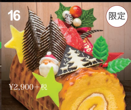
16 クリスマスキャラメル キャラメルムースをキャラメルソースでコーティング。中にはとろけるロールケーキ。 (12cm)