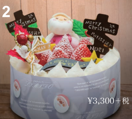
2 5号生クリーム ふんわりスポンジをいちごと生クリームで仕上げた、みんな大好きクリスマスの定番。 (直径15cm) 3~4人用