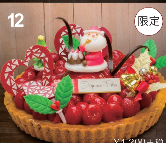
12 さくらんぼのタルト リビドー自慢のタルトに、たっぷりカスタード。真っ赤なさくらんぼが可愛く踊ります。 (直径18cm)